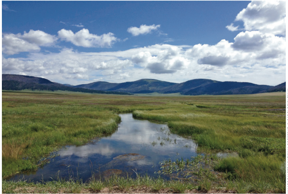
VALLES CALDERA NATIONAL PRESERVE

DESDE LOS BOSQUES subalpinos en el norte hasta el desierto de Chihuahua a lo largo de la frontera sur, Nuevo México es uno de los estados más biológicamente diversos del país. Defenders of Wildlife ha trabajado durante mucho tiempo para proteger la vida silvestre en peligro que depende de los variados parajes del estado, incluyendo la Cuenca Alta del Río Grande y la Gran Bioregión de Gila, y para amplificar el apoyo a favor de la conservación de la vida silvestre.